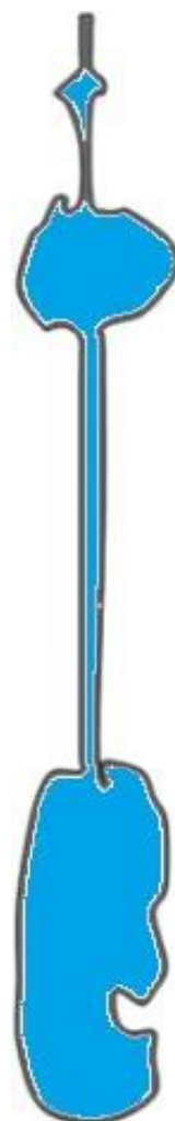
Figura 2 - Il fiume Giordano

Distinguiamo adesso i due tipi di cartine: la Palestina politica e fisica.