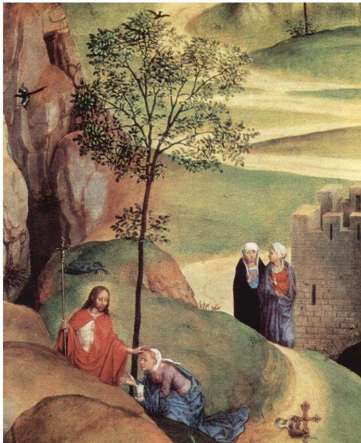
Le sette gioie di Maria, particolare (1480 circa) – Hans Memling