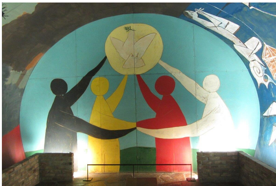
Pablo Picasso, La Guerra e la Pace (particolare) - Musée National Picasso (Vallauris)

Ho voluto dipingere il sogno di pace dell'umanità... Forse in questa casa verranno giovani e meno giovani a cercare un ideale di fraternità e d'amore come i miei colori l'hanno sognato. Forse non ci saranno più nemici... e tutti, qualunque sia la loro religione , potranno venire qui e parlare di questo sogno, lontano dalla malvagità e dalla violenza. Sarà possibile questo? Credo di sì. Tutto è possibile se si comincia dall'amore".