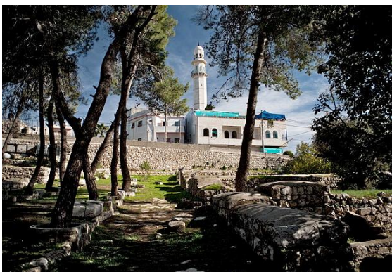
Figura 2 Strada romana vicino alla chiesa di Emmaus - al Qubeibeh

Nikopolis , il nome con cui Emmaus è stata ribattezzata dai Romani nel terzo secolo, era una grande città del periodo bizantino. Non tutti concordano nell'affermare che Emmaus corrisponda a questo luogo, per via della troppa distanza da Gerusalemme. Il vangelo di Luca al capitolo 24, 13 scrive infatti che le due città (Gerusalemme ed Emmaus) sono lontane 60 stadi, ovvero 7,5 km contro i 30 di Nikopolis. Per questo motivo, i Francescani di Terra Santa hanno occupato il sito di al-Qubeibeh dal 1335 perché lontano solo 11 km da Gerusalemme.